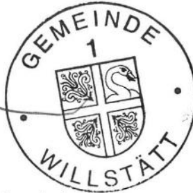
Tobias Fahrner Erster Bürgermeister-Stellvertreter