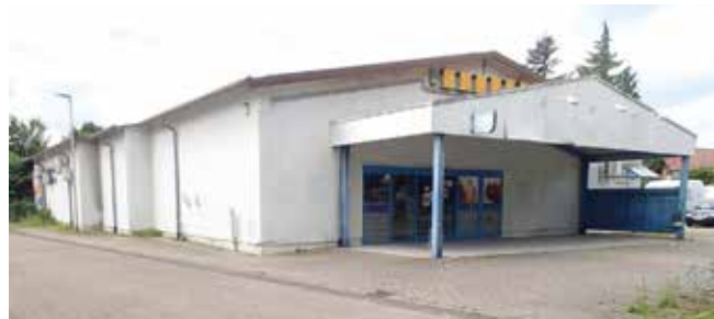
Alte Markthalle Legelshurst