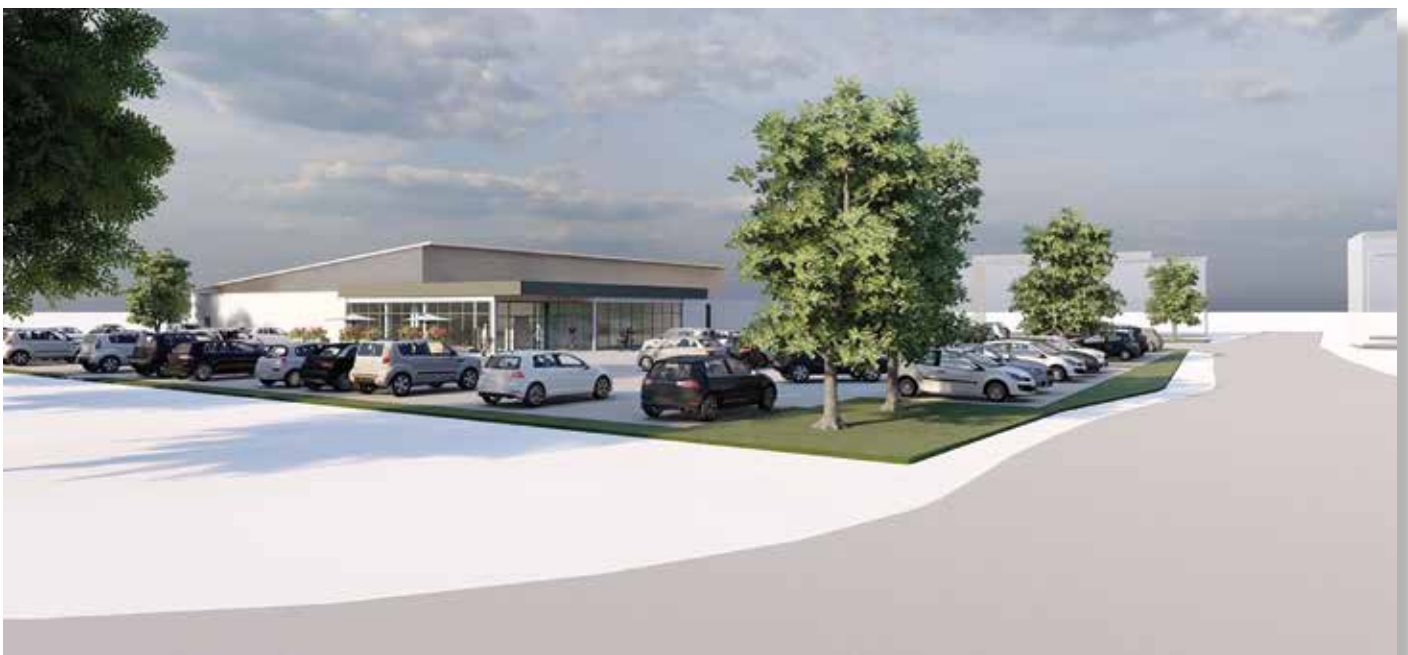
Computervisualisierung geplanter Markt