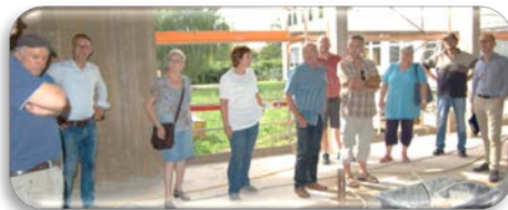
Besichtigung der Baustelle Moscherasch-Schule durch den Gemeinderat