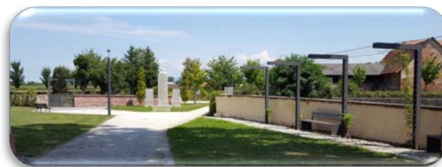
Neue Ortsmitte Eckartsweier