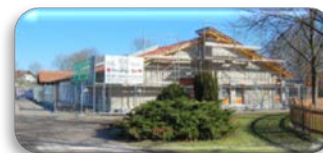
Anbau „Kindertreff“ Willstätt

Aufgrund des gestiegenen Bedarfs an Betreuungsangeboten forciert die Gemeinde eine Erweiterung der kommunalen Kindertageseinrichtungen.