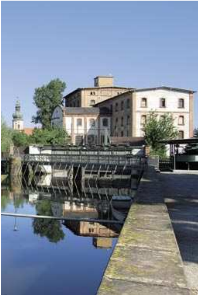
Industriedenkmal: Das ehemalige Mühlengebäude soll saniert und für andere Zwecke umgenutzt werden.