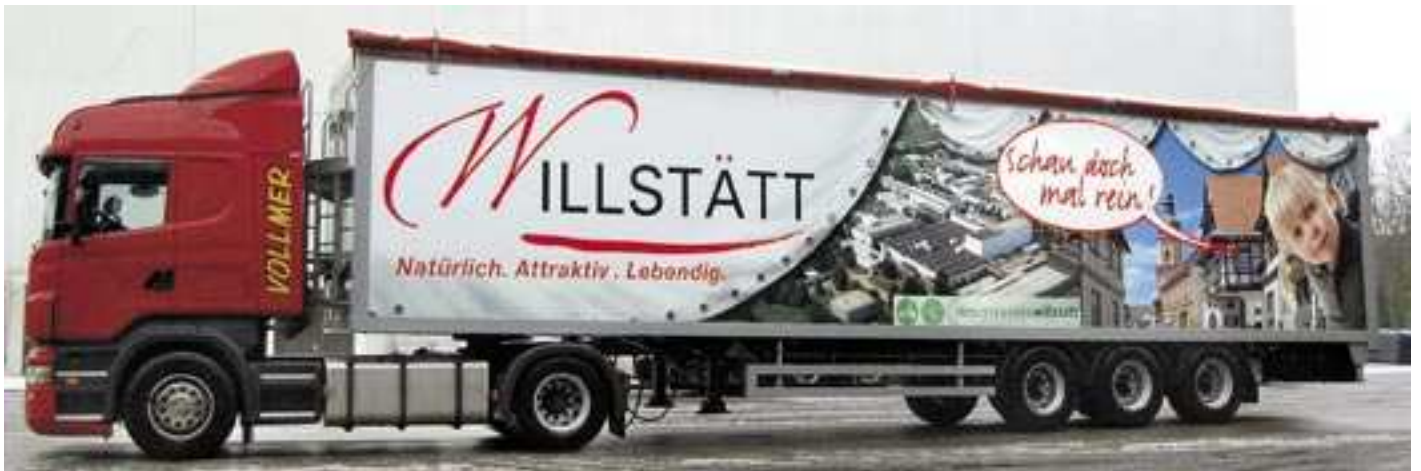
Rollende Anzeige: Mit einem Lkw der Spedition Vollmer machen Gemeinde und Industriepark Werbung für den Wirtschaftsstandort.

Möglichst viel Energie aus natürlichen Ressourcen zu gewinnen ist das Anliegen des Willstätter Bürgermeisters. Als Teilnehmer der von der Deutschen Umwelthilfe unterstützten Imagekampagne SolarLokal setzt die Gemeinde sich für eine stärkere Nutzung der Sonnenenergie ein (siehe Seite 58), und die Hilzinger-Gruppe engagiert sich mit ihrer Kampagne „Klimaschutz – ich bin dabei“ für den Umweltschutz und gegen den Klimawandel.