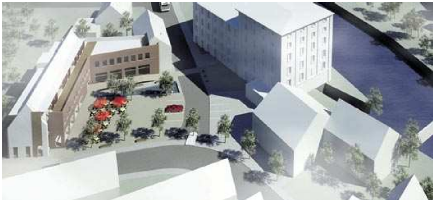
Modell der neuen Ortsmitte in Willstätt: Links das Wohn- und Einkaufsgebäude, rechts das ehemalige Mühlengebäude am Kinzigufer.