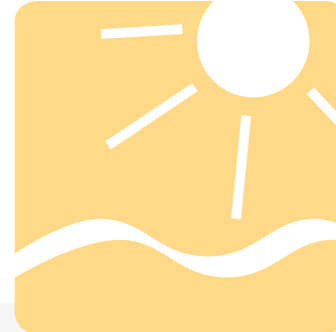
Natürlich. Attraktiv. Lebendig.